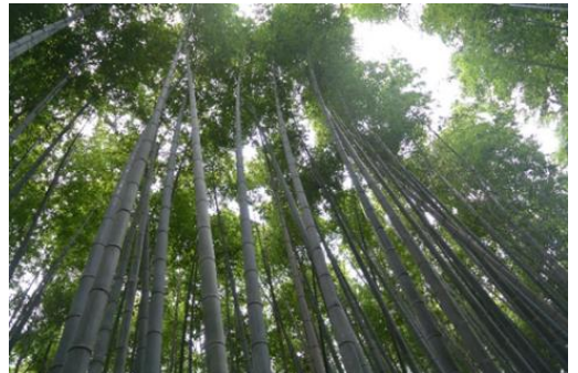
3 日目 クラス行動 嵯峨野竹の道