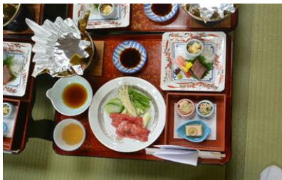
2 日目 会席料理体験