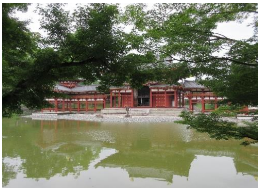
3 日目 クラス行動 宇治平等院