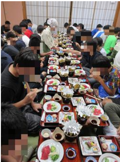
2 日目 夕食