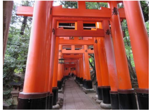
2 日目 京都市内班行動 伏見稲荷