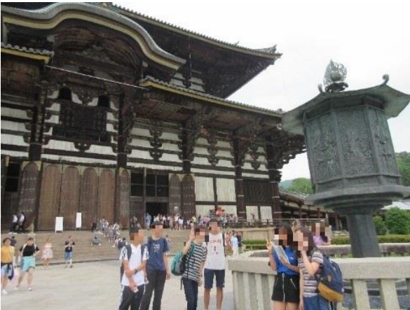
1 日目 奈良班行動 東大寺大仏殿前でパチリ