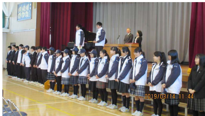
3年生のレスキュー隊員の皆さん