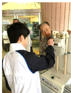
区修了式 合同訓練にて

3月3日、杉並区中学生レスキュー隊の今年度の修了式が阿佐ヶ谷中で行われました。77名を代表して修了証を受け取りました。14日の天沼中校内レスキュー隊修了式では、3年間、レスキュー隊で活躍した生徒の代表として、「レスキュー隊の活動の紹介」と「レスキュー隊に所属してよかったこと」などを語ってくれ、在校生にレスキュー隊の今後を託しました。