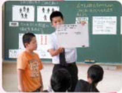
校内研究～算数科の指導～