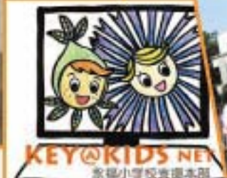
ケヤキッズ・ネット(HP)