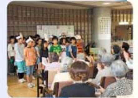
永福ふれあいの家との交流(3年)