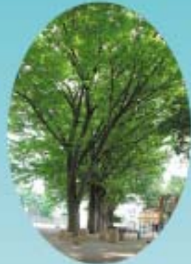
永福小のシンボル (けやき)

永福小学校では、 教育目標のもと、 学力向上・体力向上・ 健全育成をめざして、 教育活動に 取り組んでいます。