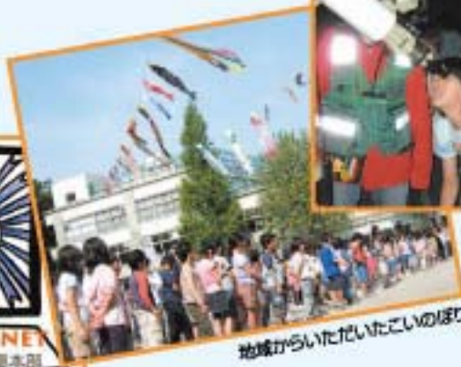
地域からいただいたこいのぼり