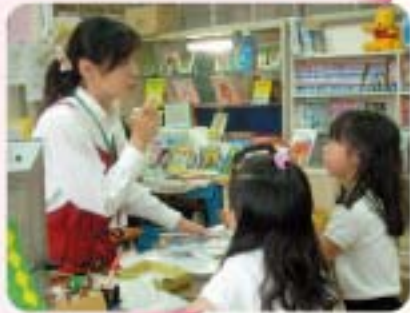
学校図書による読書指導