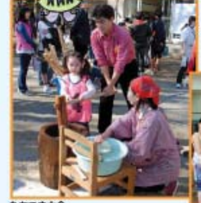
もちつき大会 (地域の会・PTA・学校支援本部の共催で実施)