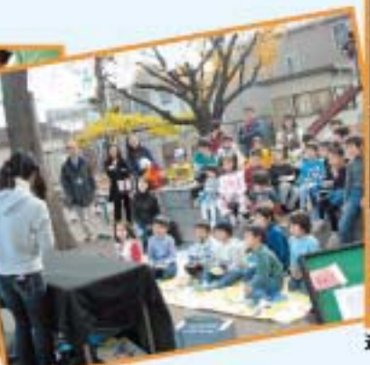
祝祭ボランティア