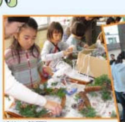
ピオトーブ応援隊