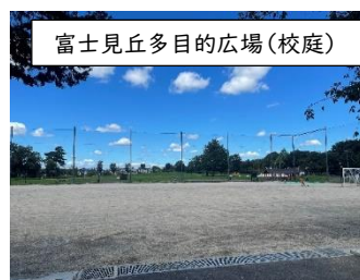
富士見丘多目的広場(校庭)