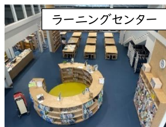
ラーニングセンター