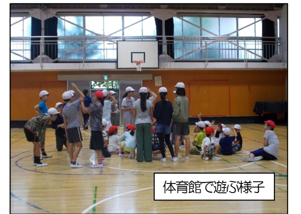
体育館で遊ぶ様子