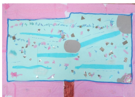
4-1 O.A 『さくらちる川』