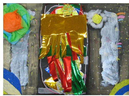
4-2 H.M 『ゆめのくうかん』