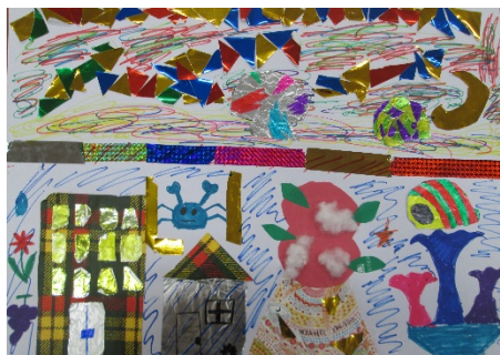
4-3 M.A 『かわった世界』