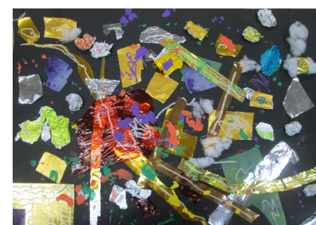
4-2 M.T 『黄金スプラトゥーン!』