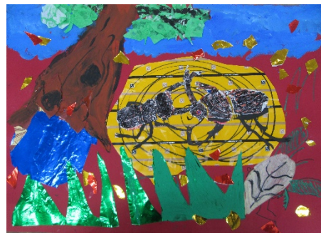
4-1 Y.G 『夏だ！カブト VS クワガタ』