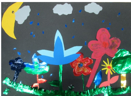
4-2 R.U 『おはな』