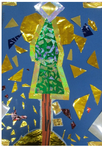
4-1 Y.Y 『金だらけのふしぎな木』