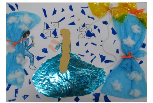
4-3 N.K 『雨のふる日に…』