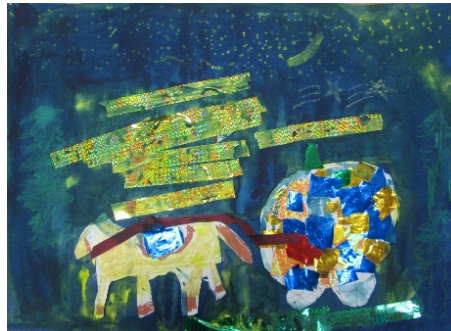
4-2 N.M 『オーロラを走る馬車』