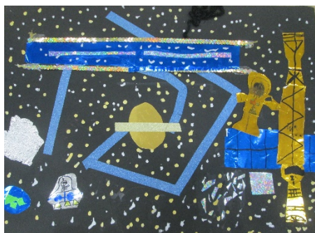
4-1 K.S 『宇宙から星をながめて』