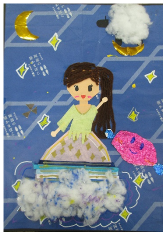
4-2 I.A 『夜に…』