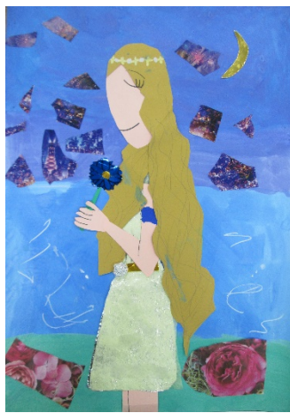
4-3 O.M 『ひみつの一夜』