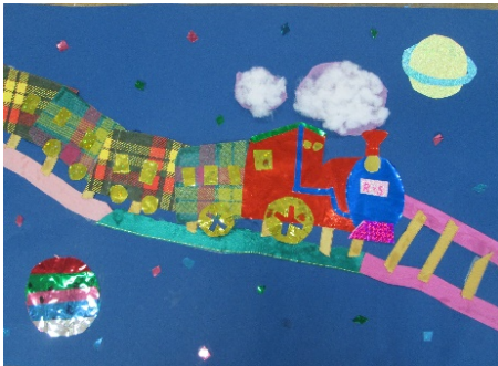
4-1 S.R 『夜空を走れ！ぎんが鉄道』