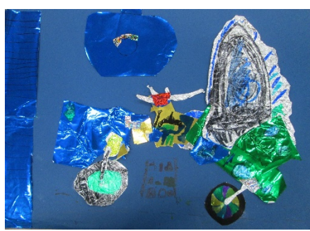
4-3 S.Y 『バイクのガレージ』