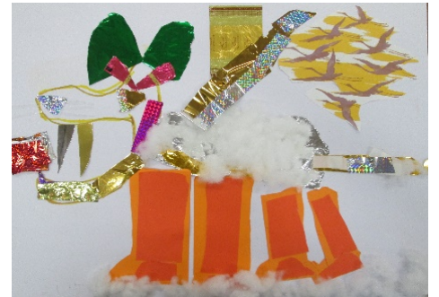
4-3 M.H 『空想どうぶつ つる&サーベルタイガー』