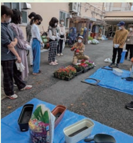
10月 花ボランティア