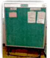
予約・リクエスト

お知らせボード *館内にあります。 本を予約、リクエストした人は、チェックしに来てください。