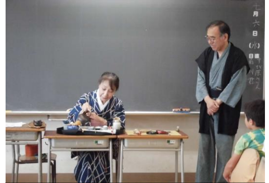
4年「お茶に親しもう」 ～地域の専門家に学ぶ～