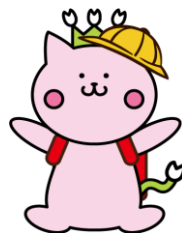
80周年記念キャラクター