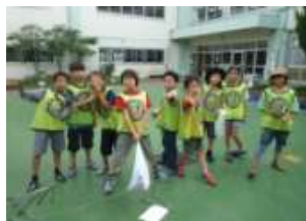
荻中生との クリーン運動

みんなの「川の中に入って遊びたい、ホテルの住む川にしたい、土手のある里川にしたい!」という願いが実現するようにこれからも活動が続けていきます。