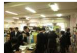
(しおりコンテストと図書館クイズの様子)