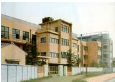
昭和 36 年当時の校舎

今まで本校を支えてくださいましたすべての皆様に心より感謝申し上げ、今後とも子どもたちの健やかな成長のために一層のご支援を賜りますよう、お願い申し上げます。