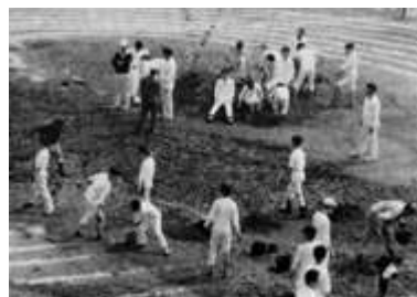
昭和 39 年出水騒ぎの運動場