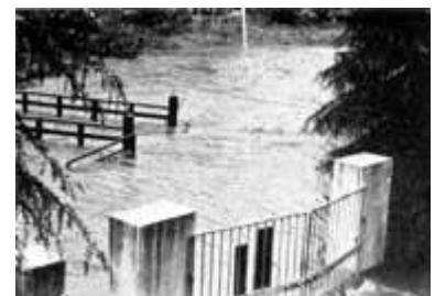
昭和 41 年台風 4 号旧正門付近