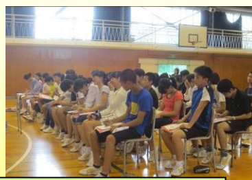
2年生「職場体験発表会」の様子：聴き手を引き付ける見事な発表でした ↑