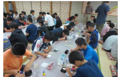
修学旅行「漆器の加飾」体験の様子