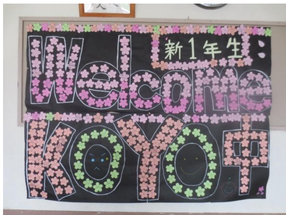
生徒会制作の「新入生へのメッセージ」西昇降口前廊下に掲示