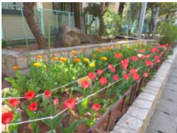
きれいに咲きました！ 東門付近の花壇(みどりボランティア)