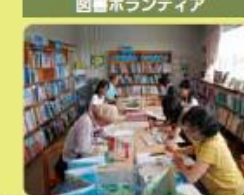
図書ボランティア