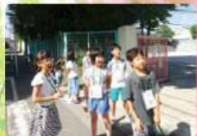
あいさつウィーク 当番の子供たちが、明るく元気な声で呼びかけ ています。