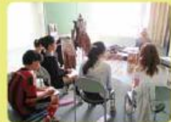
総合的な学習の時間や各教科の時間、読み聞かせ、校内の木や花の見守り等、様々な場 面でサポートしてくださっています。