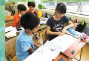
ペア学習 全ての教科で、お互いの考えを伝え合う学習を重 視しています。