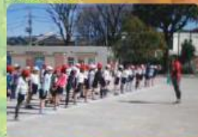
専門家による指導 オリンピックやパラリンピアンを招いて、授業を 行っています。