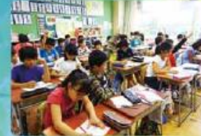
チャレンジタイム 火・木の朝15分間、国語の学習に取り組んでい ます。