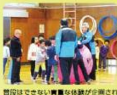
普段ではできない貴重な体験が企画され ています。