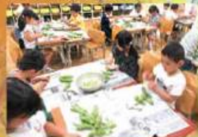
食育 さやから出したそらまめは、給食でおいしくい たできます。