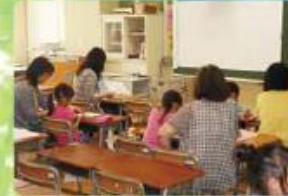
夏休みパワーアップ教室 基礎的・基本的な学習内容の定着を図ります。