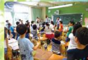
外場活動 ALTやJTEと一緒に活動し、コミュニケーション 能力を高めます。