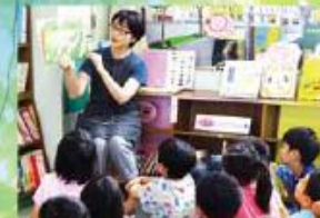
読書活動 学校司書のブックトークや読み聞かせ等、読書 に励む子供を育てています。