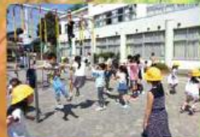
休み時間 30分の中休みには、たくさんの子供たちが 外で元気いっぱい遊んでいます。