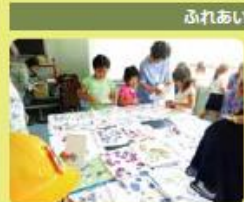
ふれあいフライデー