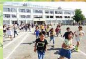
くっかけトライヤル 毎週金曜日の朝に、長縄・短縄・持久走等を継続 して行っています。