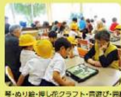
琴・めり絵・押し花クラフト・書道・器楽・将棋・オセロ・英語・ドッジボール・・・毎週 金曜日の中休みを地域の方々と一緒に過ごします。