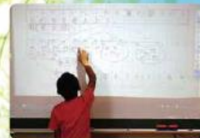
ICTの活用 デジタル教科書や映像資料を活用した授業をし ています。