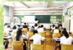
全学年 算数少人数指導 習熟度別授業で、学び強しをなくします。