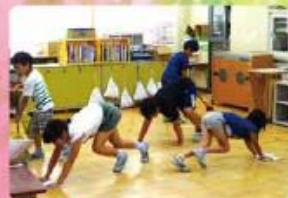
たてわり清掃 毎週金曜日、異学年リーダーを中心にみんなで 学校をきれいにします。