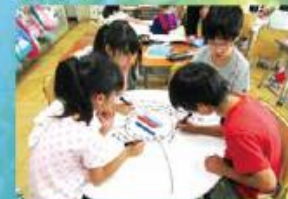
グループ学習 円卓やホワイトボードを使って、友達と考えを交 流しています。