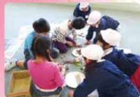
幼保小の交流 近隣の保育園・幼稚園の園児たちと様々な交流 しています。