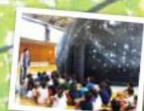
移動式プラネタリウム