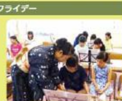
おはなし会どんぐり