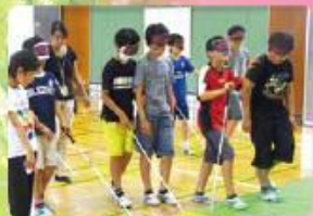
5年 共に生きよう 高齢者体験やアイマスク体験を通して、すべての 人にとって住みよい町作りを考えます。