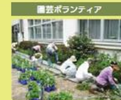
園芸ボランティア