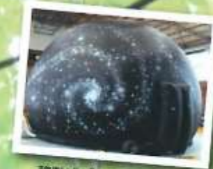
移動式プラネタリウム