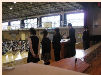
前期生徒会長から