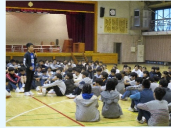
縦割り練習会の様子