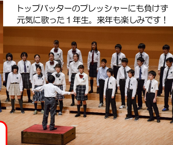
トップバッターのプレッシャーにも負けず 元気に歌った1年生。来年も楽しみです！