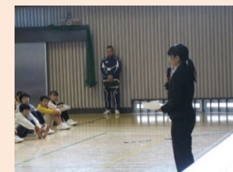
生徒会サミット報告