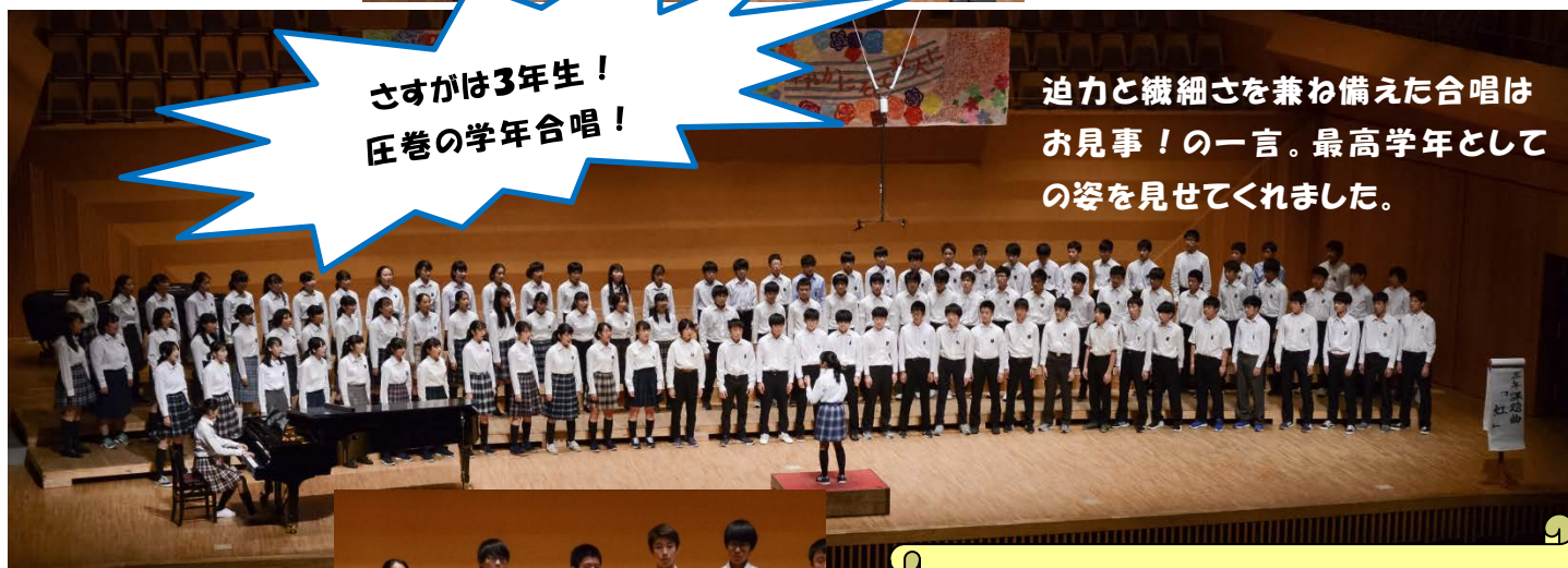
さすがは3年生！ 圧巻の学年合唱！