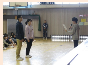
美化コンクール表彰