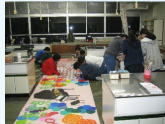
美術部による横断幕作成