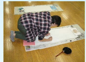
有志によるめくりプロ作成