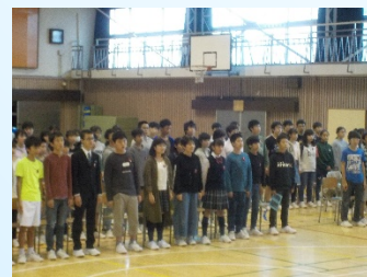
学年リハーサルの様子