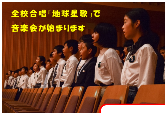
全校合唱「地球星歌」で 音楽会が始まります