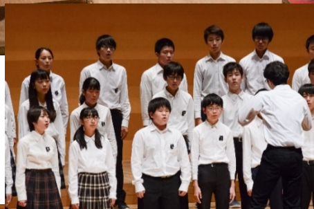
会場も一体となった “西宮サウンド♪” ↓