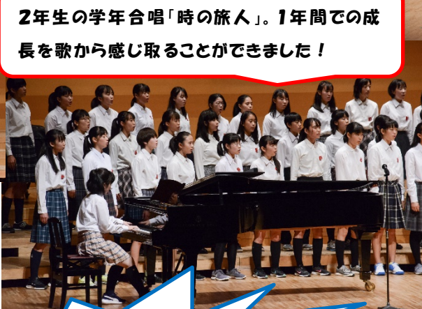
2年生の学年合唱「時の旅人」。1年間での成 長を歌から感じ取ることができました！