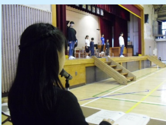
前々日の進行リハーサル