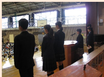
後期生徒会長から