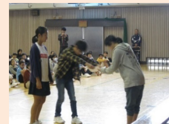
給食準備コンクール表彰