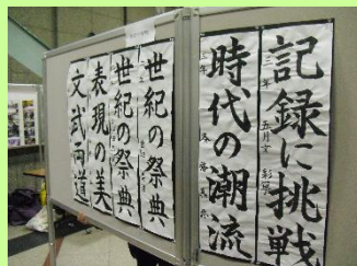
杉並区書き初め展の様子

国語科の冬休みの宿題として出される書き初め。日本の伝統文化を学ぶ機会になっています。今年も力作がずらりと並び、見ごたえのある展示になりました。また、校内の金賞作品から各学年2点ずつの作品が選ばれ、杉並区書き初め展に出品されました。区役所1階ロビーには、区内各学校の優秀作品が展示され、見ごたえのある展示になっていました。