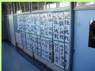
校内書き初め展の様子

『校内書き初め展』 1/10日(水)～30日(火) 『杉並区書き初め展』 1/20日(土)～26日(金)