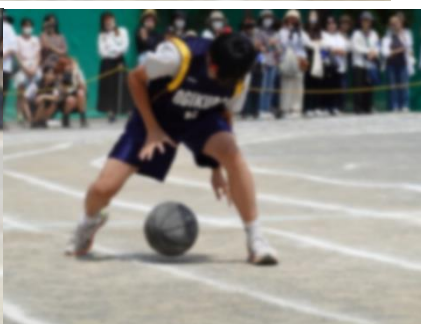
部活対抗リレーさまざま