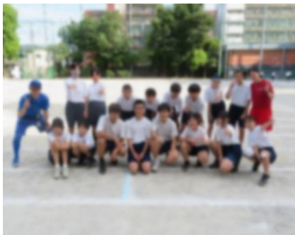
実行委員勢ぞろい！

5月27日（土）に、第72回運動会が晴天の中開催されました。3年ぶりに、思いっきり取り組んだ運動会になりました。延べ人数で、800人を超える保護者の方々やご家族など、多くの参観者に応援をいただき、大きな思い出と達成感を得ることができた運動会でした。4月から運動会実行委員会が結成され、運動会スローガン『One for all, All for one. (一人はみんなのために頑張り、みんなは一人のために頑張りよう)』の下、生徒会の企画した部活動対抗リレーをはじめ、みんなが楽しめる運動会が実現できたと思える、感動的な一日となりました。荻窪中学校の生徒の底力がまさに発揮された学校行事になりました。