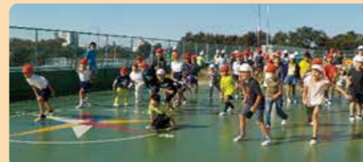
にっこり班活動(異学年交流)