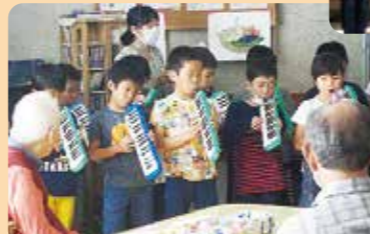
近隣高齢者施設との交流