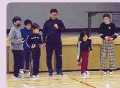
日本代表監督によるボッチャ特別授業