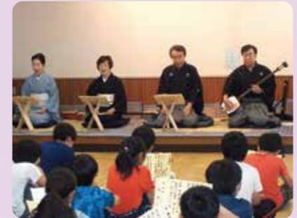
三味線・長唄体験