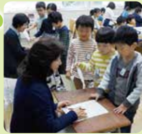
済美漢字検定・計算検定