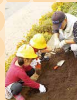
親子ガーデニング教室