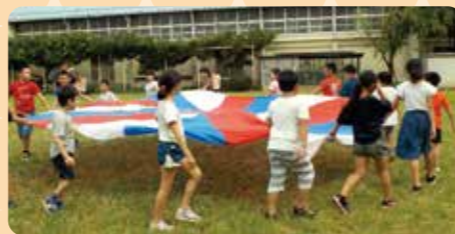
かしのみ学級、済美養護学校、 自立支援施設との交流

異学年交流や近隣保育園や学校・施設との交流活動、国際理解教育、読み聞かせなどを通して豊かな人間性を育み、地域を大切に育てます。