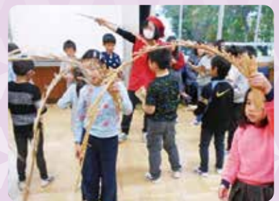
南京玉すだれ体験