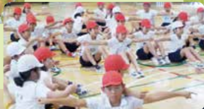
コーディネーション トレーニング