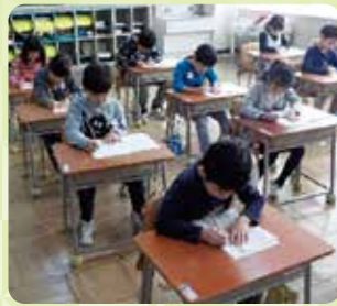
基礎基本の定着学習