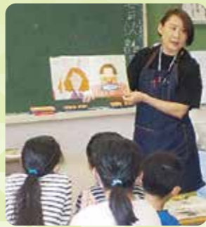
学校司書による読み聞かせ