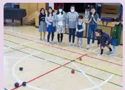
済美小ボッチャ大会