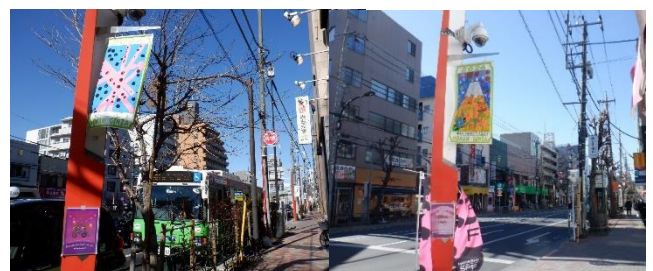
環七や方南通りの街燈下に掲示されています