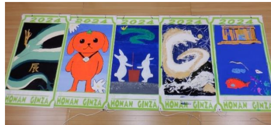
泉南中のフラッグは現在制作中です

方南銀座商店街の依頼により、例年、地域の小学校・中学校・特別支援学校の子供たちが描いたフラッグを大通りの街燈下に掲示しています。本校生徒も、現在フラッグを製作中です。方南通り、環七、西口通りなど、近隣の街燈に今年1年間掲示されるとのことですので、ぜひご覧ください。