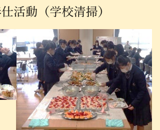
3月14日(木)バイキング給食とメニュー表