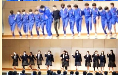
3月12日(火)ダンス発表会