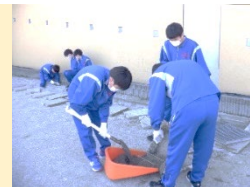
3月14日(木)奉仕活動(学校清掃)