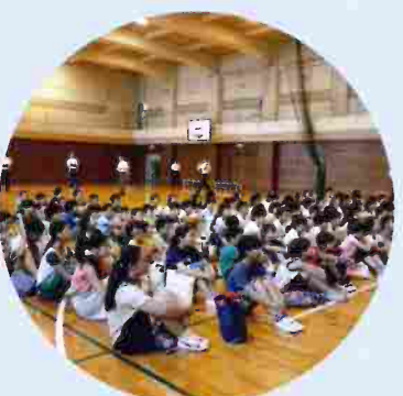
和泉中の体育館でオリエンテーション。

9月6日、新泉小・和泉小の両校の6年生が、今年也和泉中学校での授業・部活動体験を行いました。オリエンテーションでは少し硬い表情だった6年生ですが、各教室に分かれて授業に取り組む頃にはいつもの笑顔も見られるようになりました。