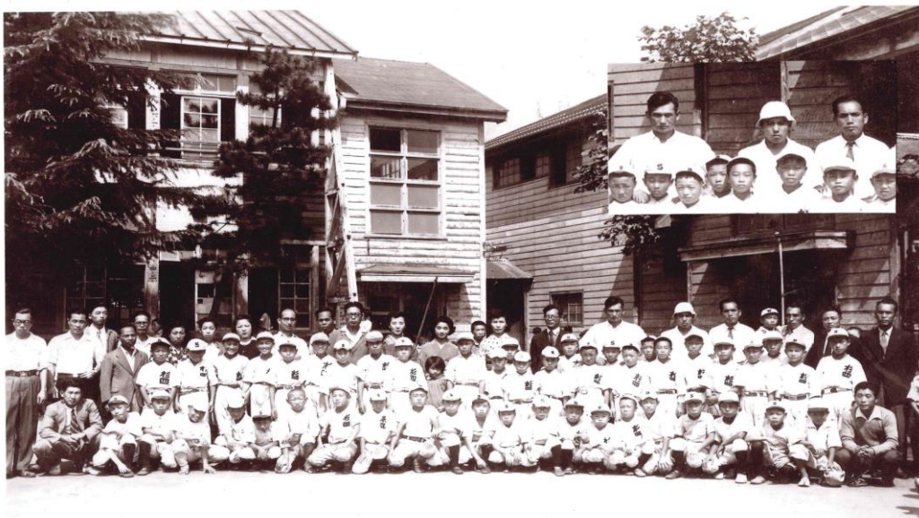
読売巨人軍 川上、千葉、三原、三選手を迎えての野球教室 昭和二十二年八月 杉並第四小学校 野球部

当時の思い出として、昭和22年に読売巨人軍の川上、千葉、三原選手を迎えての野球教室があったことをお聞きしました。貴重な写真もご寄贈いただきました。戦後の子どもたちのあこがれや希望が写真を通して伝わってきますね。