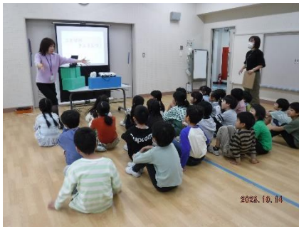
こたばの教室の説明