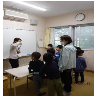
こたばの教室の施設見学