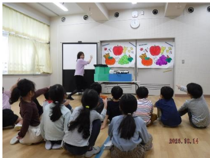
こたばの教室に関するクイズや体験