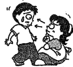
登校前に健康観察を！