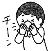
鼻をつよくみすぎない (片方ずつ)