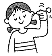
定期的に耳掃除をする (しすぎにも注意)