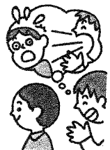
人の耳元で大声を出さない (ふざけて叩いたりしない)