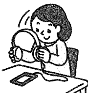
ヘッドフォンの音量は控えめに(時間を決めて)