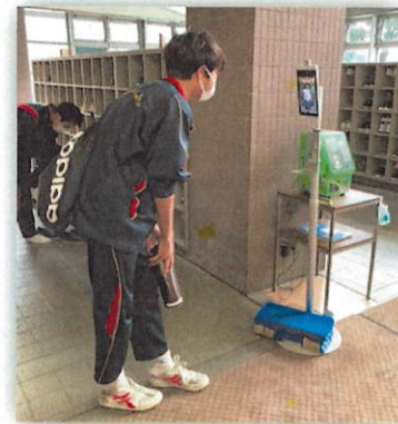
登校後、昇降口のサーモグラフィカメラで検温してから教室へ入ります。

感 染症は人類の歴史を変えてきました。紀元前3500年のメソポタミアの疫病から、ペスト、スペインかぜ、天然痘、結核など、そして現在の新型コロナウイルスに至るまで、世界中でさまざまな感染症が発生してきました。