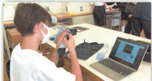
家庭科の授業でエコトートバッグを作る1年生。タブレット内にある作業工程の説明書(教員作成)を見ながら作ります。