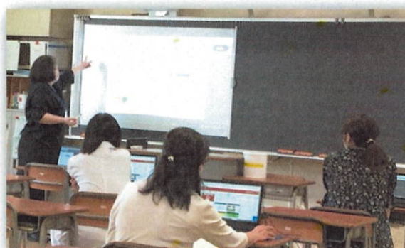
部活動のない放課後、教員もタブレットの活用の仕方について勉強しています。

これらの感染の拡大が文明を滅亡させたり、国の社会構造を変化させたりすることもありました。今まさに、時代の変化の最中にありますが、本校の生徒たちが新しい時代においても、「ゆたかに」「ねばり強く」「たくましく」「よく考えて」生きる人(本校の教育目標)であってほしいと願います。