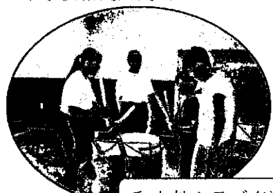
和太鼓クラブ交流