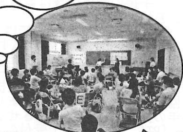
生徒会・児童会未来会議 於：高井戸中