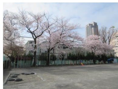
子供たちの入学、進級を祝って 咲いた西校庭の桜の花

お子様のご入学、ご進級おめでとうございます。子供たちの入学、進級だけでなく、3月に卒業していった6年生のこともお祝いしてくれた校庭の桜の花は少なくなりましたが、まだまだ子供たちのことを見守ってくれています。いよいよ今日から 令和4年度の和田小 がスタートしました。今年度は 創立90周年「WADA90」 の節目の年になります。この記念の年を子供たちと迎えられることをとても嬉しく思っています。新型コロナウイルス感染症については引き続き感染症対策を行いながら、昨年度と同様に学びを止めずに充実した教育活動を行ってまいります。本年度もよろしくお願いいたします。