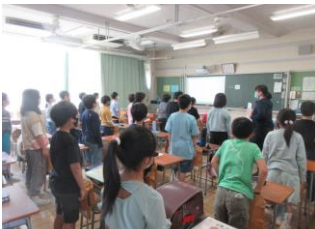
和田小の今の校歌、昔の校歌について学ぶ音楽集会

（今年は休業日にしています。）昭和7年6月1日にこの和田の町に和田尋常小学校として開校してから90年、12196名の卒業生を送り出してきました。そしてこの90年、和田の町の皆さんに大切にされてきました。昭和20年3月の東京大空襲のときに校舎が全焼したことがありましたが、終戦後、一日も早く子供たちが勉強できるようにするために、和田の町の皆さんがバザーをしたり、運動会であめやジュースを、妙法寺の縁日でりんごやかきを売ったりしてお金を集めてくれたという話が残っています。このような和田の町の皆さんの温かい思いに支えられながら、元気で明るく優しい和田健児が育っているのだと感謝の気持ちでいっぱいになります。