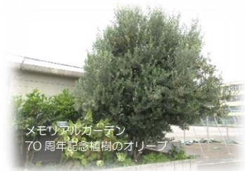
メモリアルガーデン 70周年記念植樹のオリーブ

令和3年7月16日(金) 杉並区立天沼中学校 杉並区本天沼 3-10-20 3390-0161