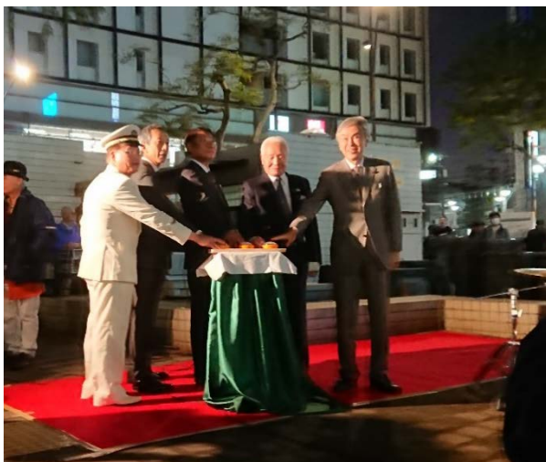
ファンファーレの後、ボタンを押して点灯!