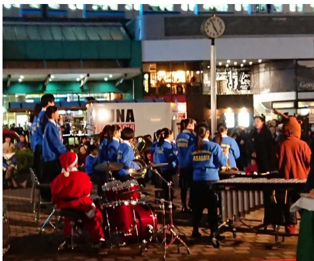
阿佐中吹奏楽部による点灯式のファンファーレ