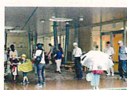
G-M-E(グッドモーニングエイフク)