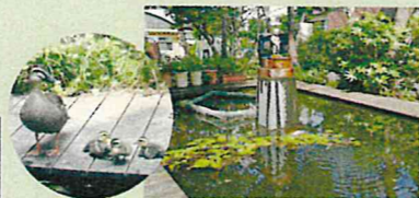
カルガモも安心して子育てする観察池