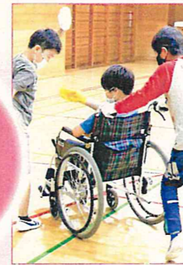
みんなにやさしいまち ～福祉の学習～