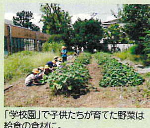
「学校園」で子供たちが育てた野菜は給食の食材に。