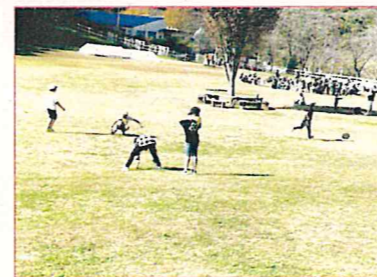
縦割りピクニック