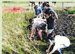
春には田植え、収穫の秋には稲刈り体験