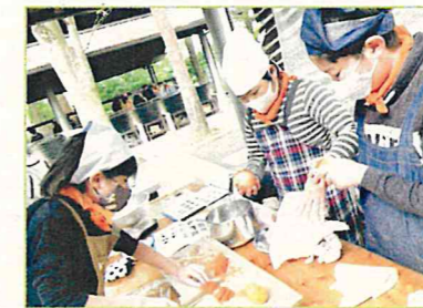
移動教室代替行事