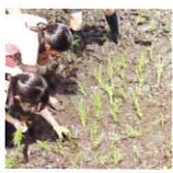
お米の苗は、永福町商店街振興組合が安曇野に手配してくれています。

また、町の子供たちの成長を見守っています。会議では地域で行われるイベントをお知らせしています。