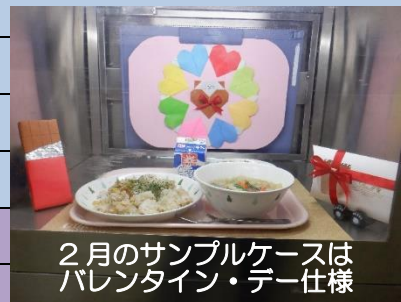
2月のサンプルケースは バレンタイン・デー仕様