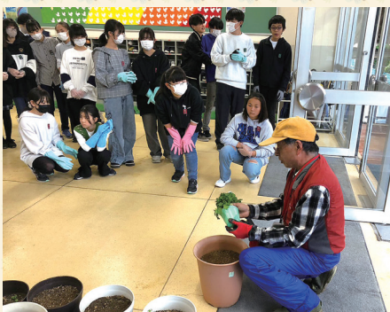
花ボランティア(大倉委員)