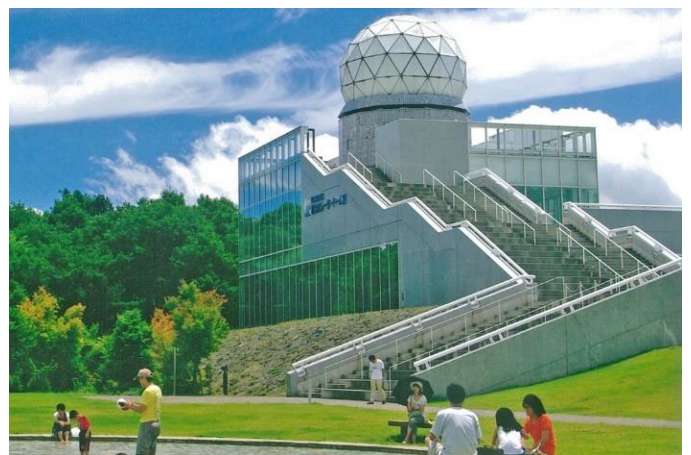
(富士山レーダードーム館)