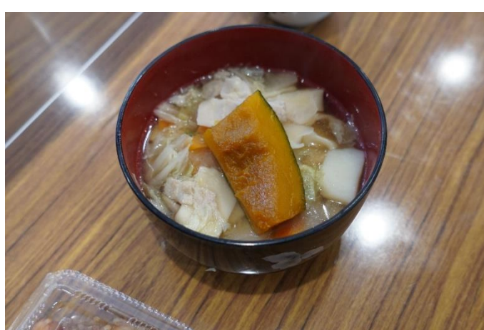
(ほうとう打ち体験)