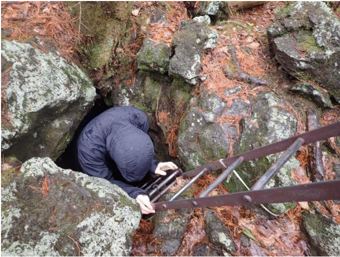
(河口湖フィールドセンター 溶岩樹型)