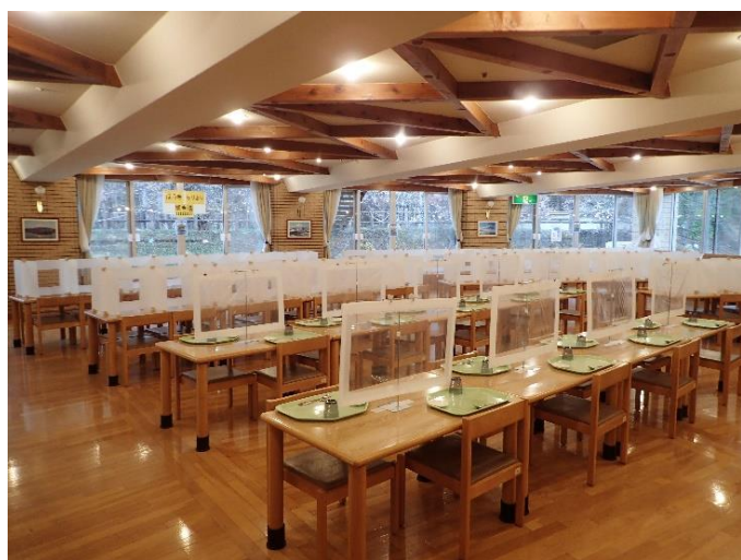
(食堂 コロナ対策 ver)