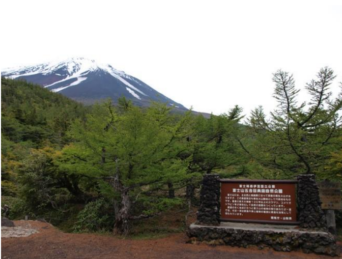
(富士山奥庭遊歩道/富士山五合目)