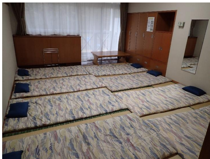
(部屋 布団あり ver)