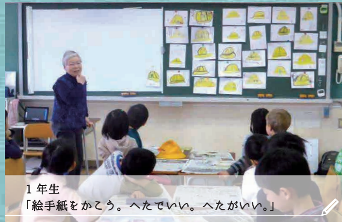
1年生 「絵手紙をかこう。へたでいい。へたがいい。」