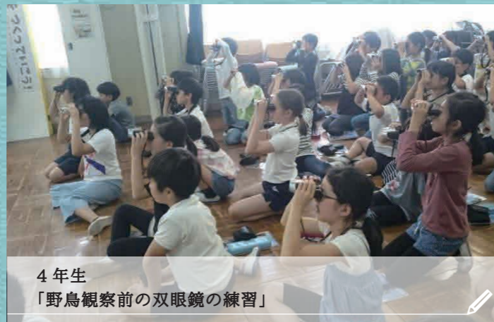
4年生 「野鳥観察前の双眼鏡の練習」