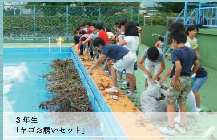
3年生 「ヤゴお誘いセット」