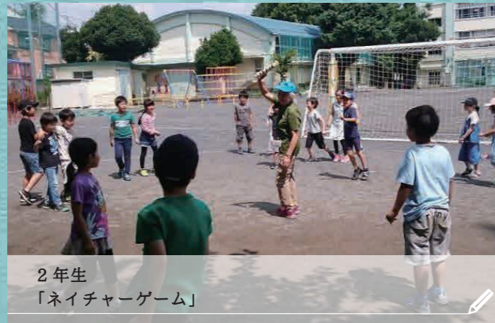
2年生 「ネイチャーゲーム」