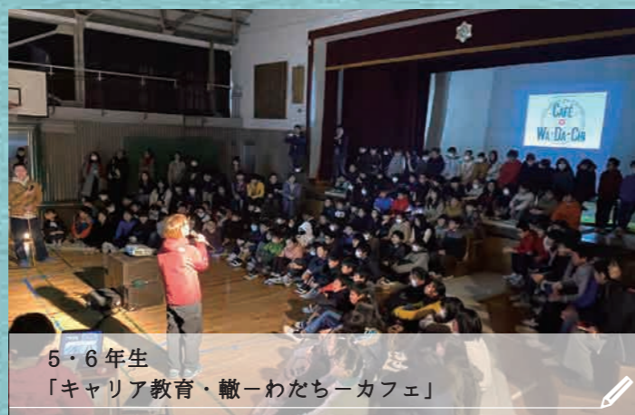
5・6年生 「キャリア教育・轍ーわたちーカフェ」