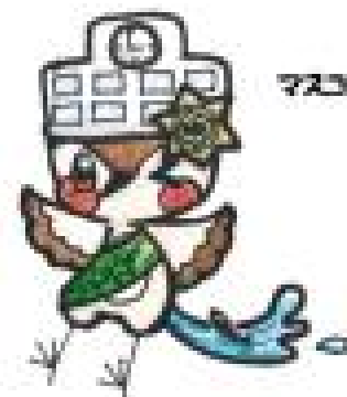
マスコットキャラクター イオギン

初めての仕事なので、至らぬ所もあるかと思いますが、どうぞよろしくお願いいたします。