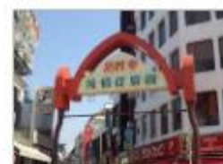
Koenji Shopping Street