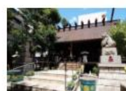
Koenji Hikawa Shrine