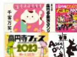
Koenji's 4 major festivals