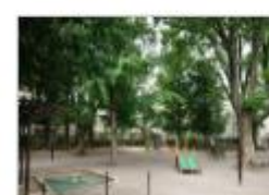
Park in Koenji