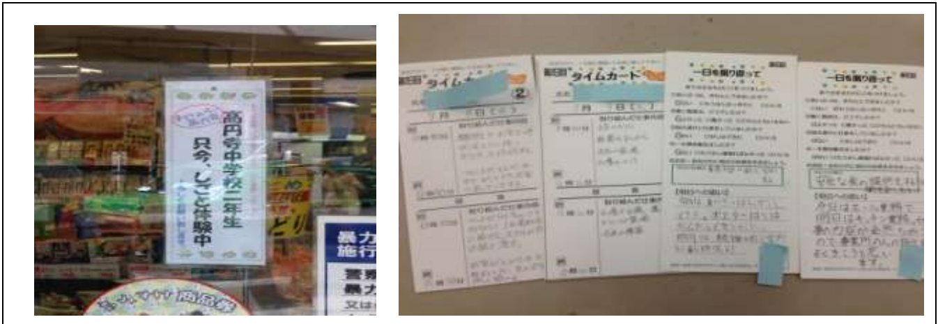
事業所に掲示されたステッカー

事業所の入り口には、写真のように、「高円寺中学校2年生 只今、しごと体験中」と書いたステッカーを貼っていただき、お客さんや地域の方々にも活動のPRをしました。