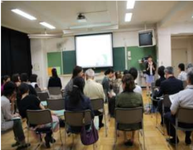
写真 食育講演会での伝言ゲームの様子

ト調査結果を基に、食育講演会を行いました。当日は、地域の皆様、保護者の皆様にお集まりいただき、熱気のある講演会となりました。「トレーサビリティ」「フードファシズム」「バランスチェック」というちょっと聞きなれない3つの言葉を柱にご講演いただきました。写真1は、参加者で伝言ゲームをした時の様子です。情報を正確に伝えることが如何に難しいかを体験しました。某人気テレビ番組で「納豆によるダイエット効果」を取り上げ、その直後、全国各地で納豆が売り切れるといった騒動がありました。しかし、実際には虚偽のデータを使っていたことが後に発覚しています。ご記憶にありますでしょうか。情報を鵜呑みにするのではなく、自分にとって本当に大切なことが判断する必要があるとのことでした。