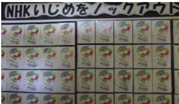
NHKの番組で使用された生徒全員のコメント(廊下に掲示してあります)