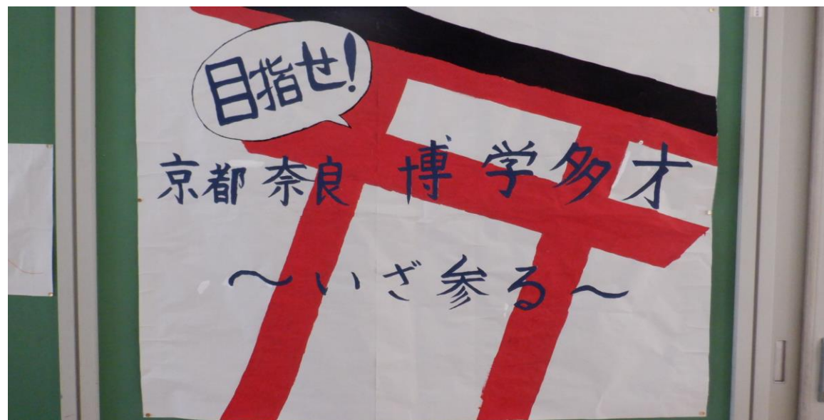
修学旅行実行委員会作成

自分のことや自分達のことだけでなく、周囲の気持ちを考えて、先を見通し自律した行動ができるように学年で振り返りをしました。ルールやマナーについては、今後お互いに声をかけて、注意し合える学年にしていきましょう。