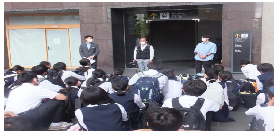
JTB●●さん、東京天然色の●●カメラマン、●●先生 ありがとうございます。