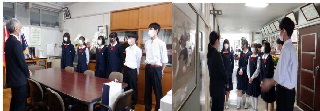
↑ 副校長先生の質疑応答も今年で3年目。実行委員としての確に回答できました。