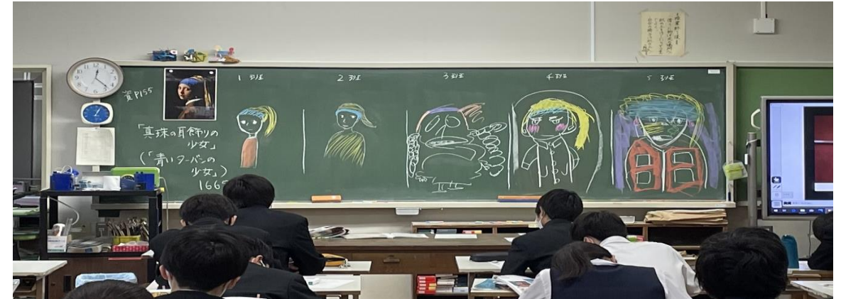
フェルメール「真珠の耳飾りの少女」グループ鑑賞)

授業の様子 美術 一人が目隠している間に原画を見た他のメンバーから聞いた情報だけで描いた真珠の耳飾りをつけた少女です！