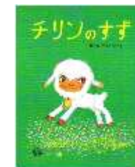
3 組阿木先生のおすすめ 「チリンのすず」