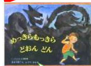
1 組岩見先生のおすすめ 「めっきらもっきらどおんどん」