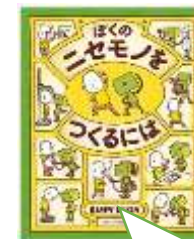
2 組岡尾先生のおすすめ 「ぼくのニセモノをつくるには」